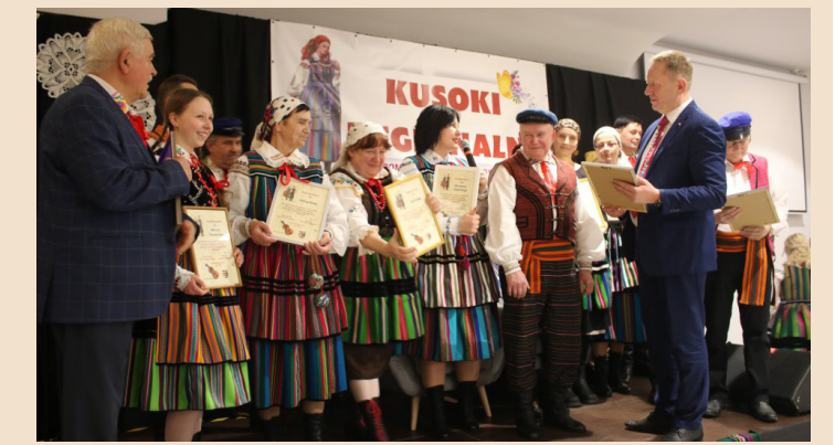
Powiat Opoczyński - Wokół Naszych spraw